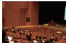
平成 29 年室内環境学会学術大会