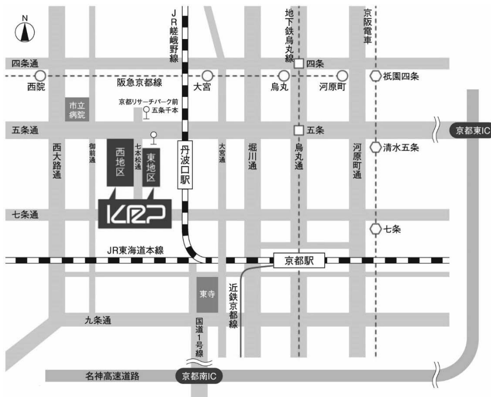
京都リサーチパーク (KRP) 案内図