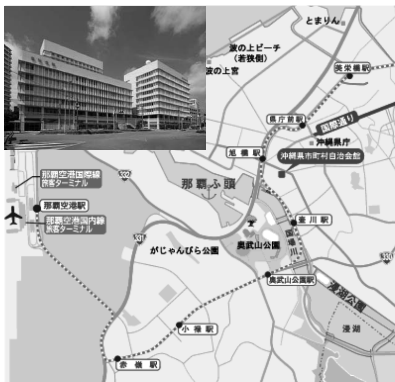
沖縄県市町村自治会館 案内図