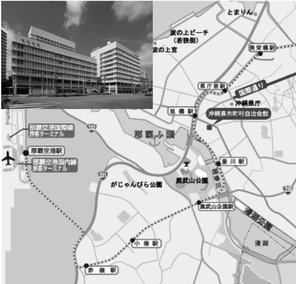
沖縄県市町村自治会館 案内図