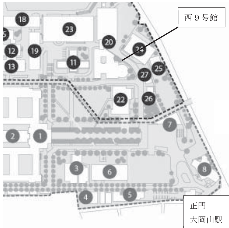
東京工業大学 大岡山キャンパス 案内図