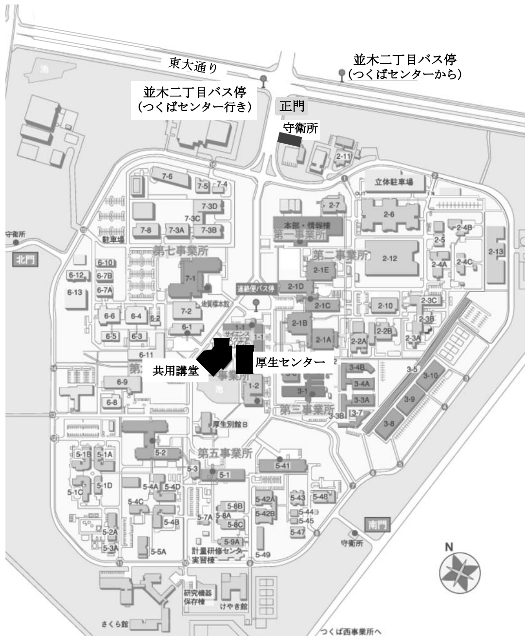
産業技術総合研究所 つくば中央事業所 案内図